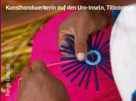
Kunsthawerkerin auf den Uro-Inseln, Titicacasee