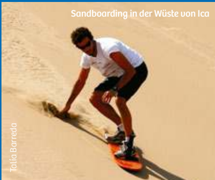
Sandboarding in der Wüste von Ica

Der Süden Perus offenbart uns noch mehr der vielfältigen Facetten des Landes. Die beeindruckenden Überreste und das bemerkenswerte Wegenetz der Inka-Kultur sowie die geheimnisvollen Nasca-Linien gehören zu den Relikten, die Zeugnis eines Jahrtausendealten Erbes sind. Die Naturschutzgebiete und die verschiedenen Landschaftsräume – Küste, Anden und Regenwald – bieten die Möglichkeit, mit der Natur in Kontakt zu treten und auf Dünen und Flüssen sowie an den Stränden Abenteuersportarten nachzugehen. Moderne Städte und eine hervorragende touristische Infrastruktur mit Hotels und Restaurants von Weltklasse sowie unzählige Traditionen und Bräuche alter Völker – all das macht Peru aus. Egal, welche Facette Sie am meisten reizt: Sie werden Unvergessliches erleben – und zwar mit allen Sinnen.