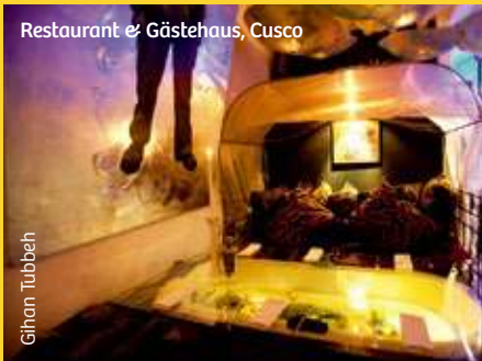
Restaurant & Gästehaus, Cusco